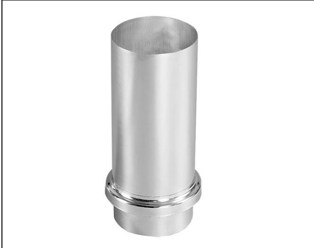
Abbildung Produktbeschreibung Technische Details