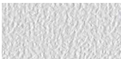
Aluminium Stucco Patina Matt