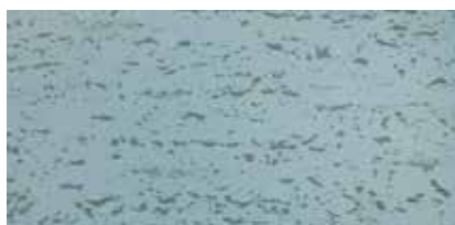
Aluminium Patina Look