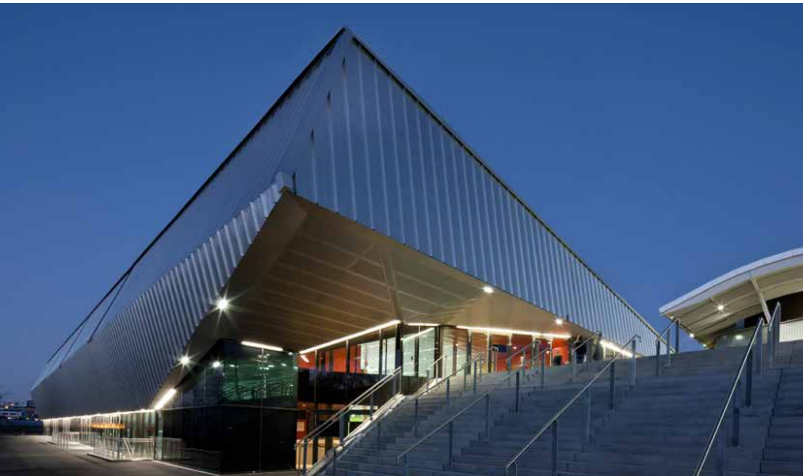
Albert-Schultz-Eishalle Wien, Österreich Aluminium stuccodessiniert

Ästhetik entsteht, wenn Form, Material und Farbe eine Harmonie bilden.