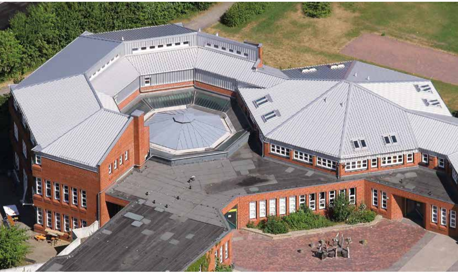
Strakerjahn-Schule Lübeck, Deutschland Aluminium Patina Matt