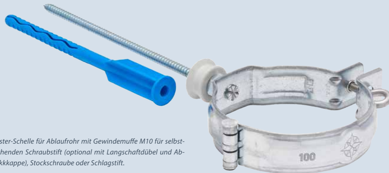
Meister-Schelle für Ablaufrohr mit Gewindemuffe M10 für selbst-furchenden Schraubstift (optional mit Langschaftdübel und Abdeckkappe), Stockschraube oder Schlagstift.

Dabei macht nicht nur das einfache Montieren Freude. Durch die perfekte Formgebung und die homogene Oberfläche verfügt die Meister-Schelle über makellose Eleganz. Entwickelt für den Alltag, designt für hervorragende Ergebnisse.